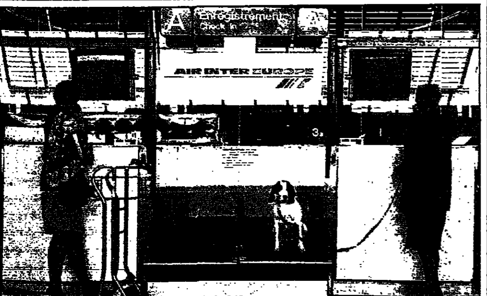
مسافران ينتظران عند مكتبين للطيوان في مطار نيس عاصمة الموظفين من اضرابهم

باريس - رويترز: ايد الموظفون الفرنسيون بضرورة استمرار اضرابهم في مطار اورلي في فرنسا يوم الاحد. وقال مسؤولون في مطار اورلي ان اضرابهم في مطار اورلي في فرنسا يوم الاحد. وقال مسؤولون في مطار اورلي ان اضرابهم في مطار اورلي في فرنسا يوم الاحد.